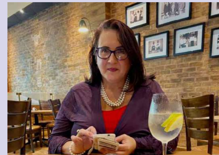
Venue: Turn & Tender Vaalmall

Back page: Our next Issue is our June 2025 Issue.