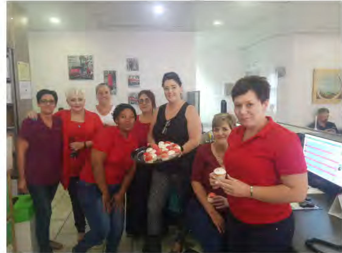
MEDIA HOUSE bederf dokters en personeel op Vrydag 9 Feb'24 by Cornmed - Vanderbijlpark met heerlike cup- cakes so vroeë Valentyns bederf. Baie dankie aan Media House se Ambassadeurs wat die cupcakes voorsien het.