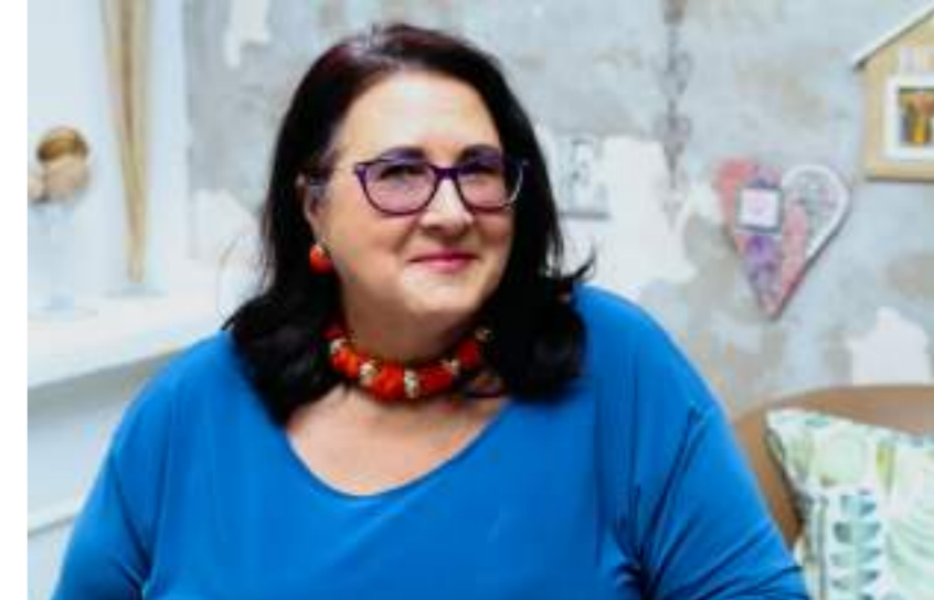
Venue: Photo Dairy & Venue

Back page - our next issue is our January Issue