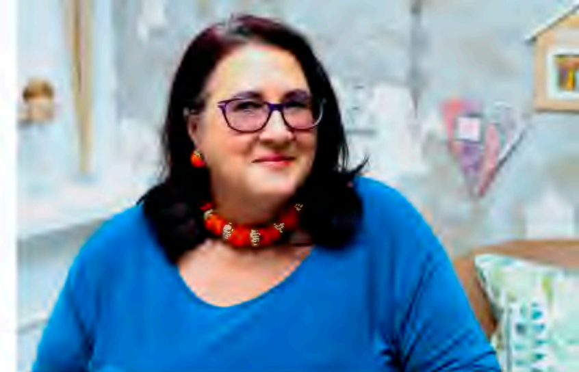
Venue: Photo Dairy & Venue