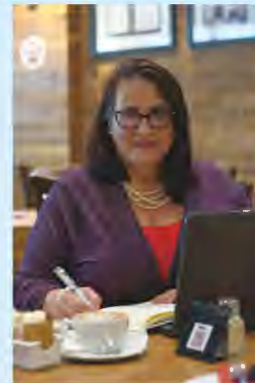
Venue: Turn 'n Tender - Vaal mall

Back page: Next Issue September remember it's Women's day 9 Aug 2022