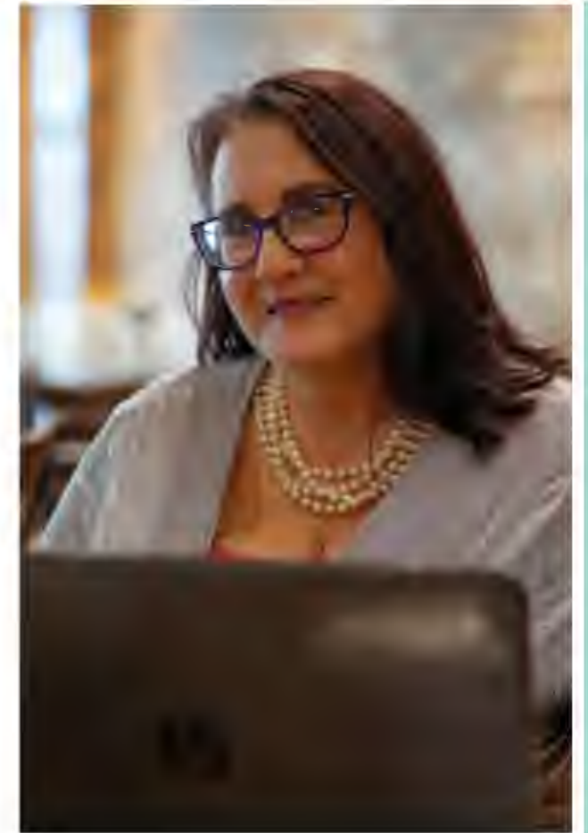
Venue: Turn 'n Tender Vaal mall