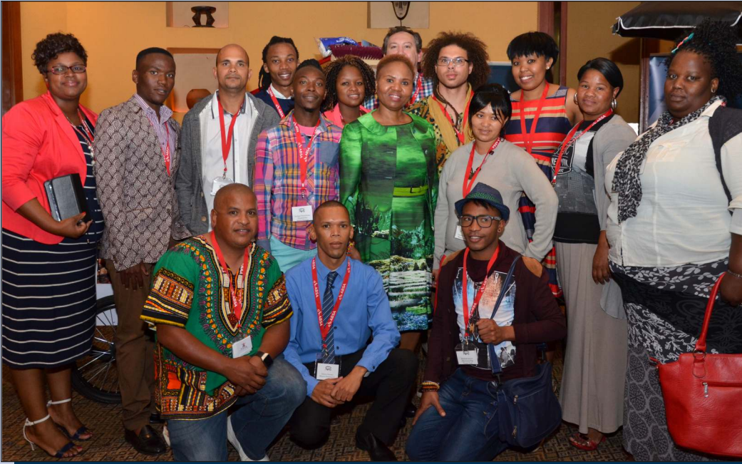
Minister van Kleinsakeontwikkeling, Lindiwe Zulu, saam met beginner-entrepreneurs tydens die AHi-kongres

Die kongres van die AHi wat onlangs gehou is, was 'n keerpunt vir die organisasie se rol in ondernemingsontwikkeling in Suid-Afrika. Sestien opkomende entrepreneurs van regoor Suid-Afrika het die kongres, wat by die Sibaya-konferensiesentrum in Durban gehou is, bygewoon. Hulle is gekies uit meer as 600 entrepreneurs in Suid-Afrika wat die AHi se entrepreneursprogram vir opkomende entrepreneurs bygewoon het.